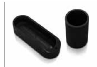
Graphite Crucible and Boat Graphit-Tiegel und -Schiffchen