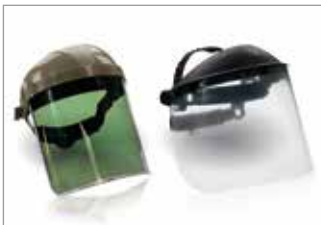
Face protection Gesichtsschutzschilde