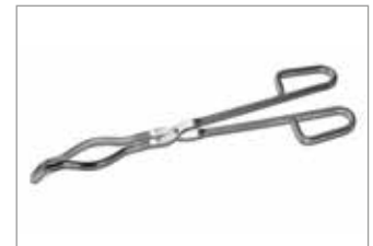
Crucible tongs Tiegelzangen