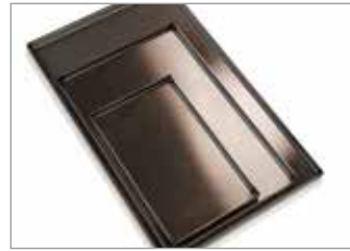
Inconel hearth trays Inconel Herdschalen