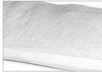
Soft insulation Fasermatte