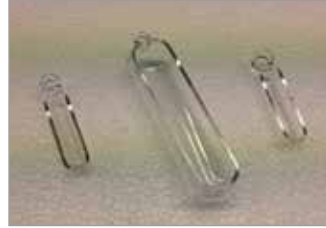
Quartz Glass Boat2 Quarzglas-Schiffchen