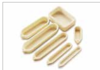
RCA Boats and Boxes RCA-Schiffchen und -Glühkästen