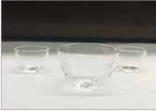
Quartz Glass Crucible Quarzglas-Tiegel