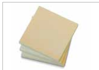
RCA Plates RCA-Platten