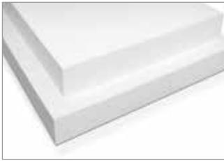
Fibre plates Faserplatte