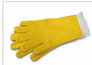
Kevlar gloves Kevlar-Hands Schuh