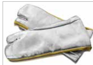
3-finger gloves 3-Fingerhandschuh