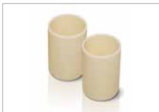
RCA Crucibles (cylindrical) RCA-Tiegel (zylindrisch)