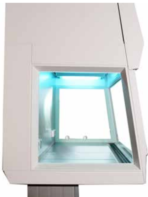
Tovejs dobbelt rettet UV-lys med Cross Beam

Premuibænken har en kantpakning som lukker hermetisk tæt når ruden køres helt ned. Denne løsning optimerer mulighederne når VHP/H2O2-sterilisering ønskes.